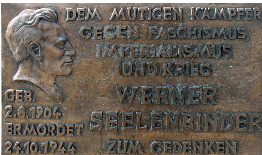
Gedenktafel für Seelenbinder am Haus Mandrellaplatz 9, in Berlin-Köpenick